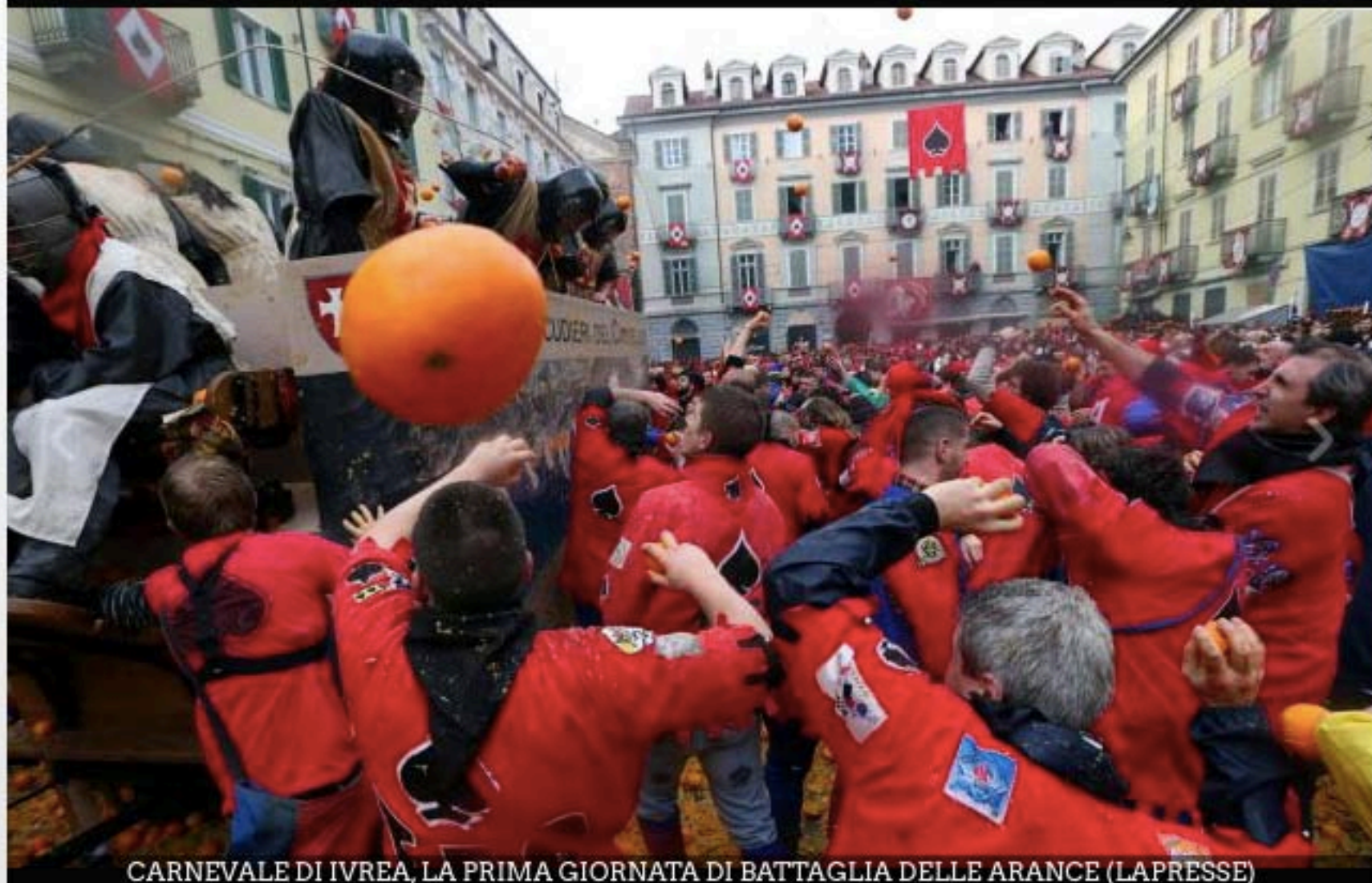
CARNEVALE DI IVREA, LA PRIMA GIORNATA DI BATTAGLIA DELLE ARANCE